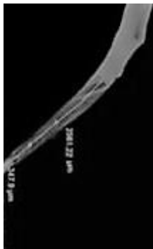
شکل ۳. قطعه شکسته شده در بلوک، اندازه گیری طول قطعه شکسته و فاصله آن تا انتهای بلوک

در مجموع از ۶۰ فایل Smart Tract X3 و ProTaper Universal (۵ فایل در یک مجموعه) و ۳۶ فایل Neoniti (۳ فایل در یک مجموعه) استفاده شد. پس از آماده‌سازی کانال، هیچ شکستگی فایل در گروه Smart Tract X3 و Neoniti مشاهده نشد، با این حال، در گروه ProTaper، یک فایل F2 پس از ۴ بار استفاده و سه فایل F2 پس از ۵ بار استفاده شکسته شدند (۶/۶٪). بر اساس آزمون مربع کای، تفاوت آماری بین گروه‌های ProTaper و Neoniti و Smart tract و ProTaper ( p=0/075 ) و گروه‌های ProTaper و Smart tract ( p=0/065 ) مشاهده نشد. تمام شکستگی فایل در گروه ProTaper در یک سوم آپیکال کانال رخ داده بود که خارج کردن آن دشوار است. میانگین طول قطعات شکسته و فاصله قطعه شکسته از راس بلوک به ترتیب 2/228 \pm 0/216 میلی متر و 0/845 \pm 0/186 میلی‌متر بود (جدول ۱ و ۲).