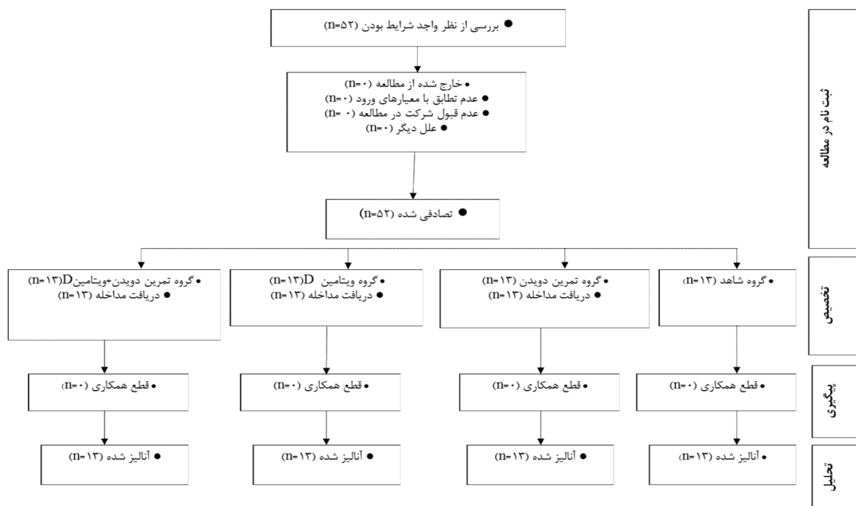
شکل ۱. فلوچارت آزمودنی‌های تحقیق