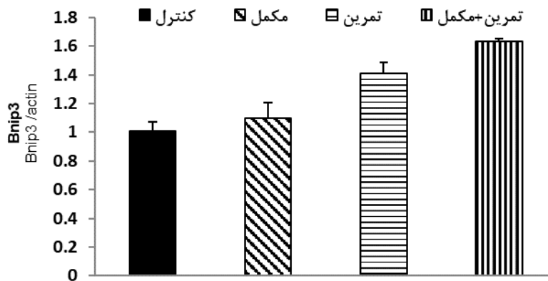
شکل ۲. مقادیر بیان ژن Bnip3 در کاردیومیوسیت‌های گروه‌های مختلف

با استفاده از آزمون آنووا یکطرفه مشخص گردید که تفاوت آماری معنی‌داری بین میانگین میزان بیان ژن Bnip3 در بین گروه‌های مختلف موش‌های نر مدل سکنه قلبی دیده می‌شود ( p < 0.0001 ). میانگین میزان بیان ژن Bnip3 در جدول ۵ گزارش شده است. نتایج آزمون تحلیل واریانس یک طرفه نشان داد که تمرین و مصرف مکمل کورکومین در تعامل با هم و نوع تمرین تناوبی به تنهایی بر میزان بیان ژن Bnip3 کاردیومیوسیت‌های موش‌های صحرایی تاثیر معنی‌داری دارد ( p < 0.0001 ). مقادیر بیان ژن Bnip3 در کاردیومیوسیت‌های گروه‌های مختلف در شکل ۲ ارائه شده است.