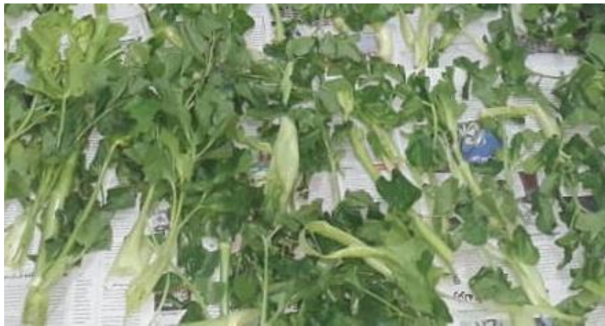
شکل ۱. گیاه آوندول

پس از تهیه نمونه‌های گیاهی آوندول، این نمونه‌ها در سایه برای مدت سه روز خشک شدند. گیاهان خشک‌شده، در آسیاب به شکل پودر درآمدند. پودر گیاه به میزان ۱۰ گرم به ۱۰۰ میلی‌لیتر اتانول ۵۰ درصد اضافه شد. نمونه پودر گیاهی همراه با الکل برای مدت یک هفته در دمای محیط همزده شد. در ادامه محلول گیاه و الکل سانتریفیوژ شد و مایع رویی