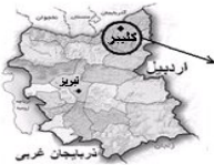
نقشه استان آذربایجان شرقی