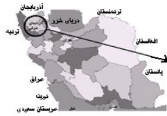
موقعیت استان آذربایجان شرقی