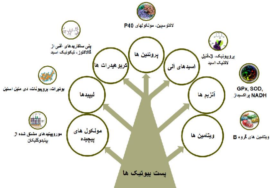
شکل ۱. انواع پست‌بیوتیک‌ها بر اساس نوع و ترکیب شیمیایی