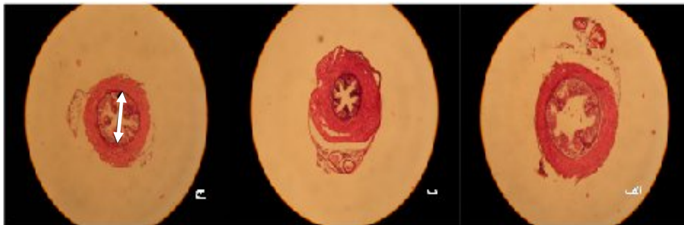
شکل ۲. تصاویر نشان دهنده نمای مجاری دفران با میکروسکوپ نوری در گروه های مختلف می باشند. الف: گروه کنترل که، قطر طبیعی مجرای دفران را نشان می دهد (پیکان). ب: گروه تحت استرس کم یک ماهه به کاهش قابل توجه قطر مجرای دفران دقت کنید (پیکان). ج: گروه تحت استرس زیاد دو ماهه کاهش قطر مجرای دفران مشاهده میشود (پیکان) (بزرگنمایی ۱۰).