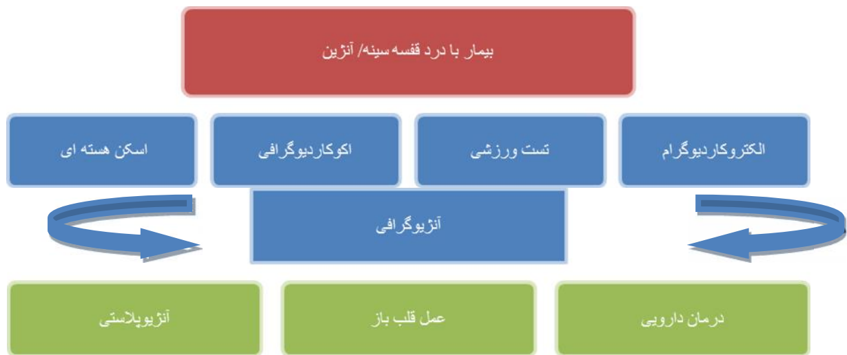
شکل ۱. فرآیند تشخیص و درمان بیماری عروق کرونر قلب [۳۰]