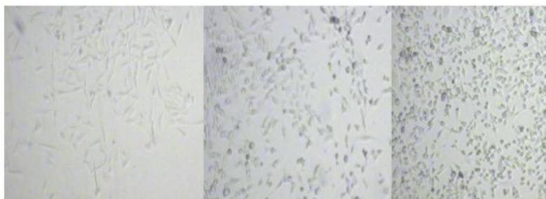
شکل ۱. تصاویر کشت MTT سل لاین PC 3 به ترتیب از چپ به راست: کنترل، ۱ppm عصاره قره‌قات و 600 ppm عصاره قره‌قات