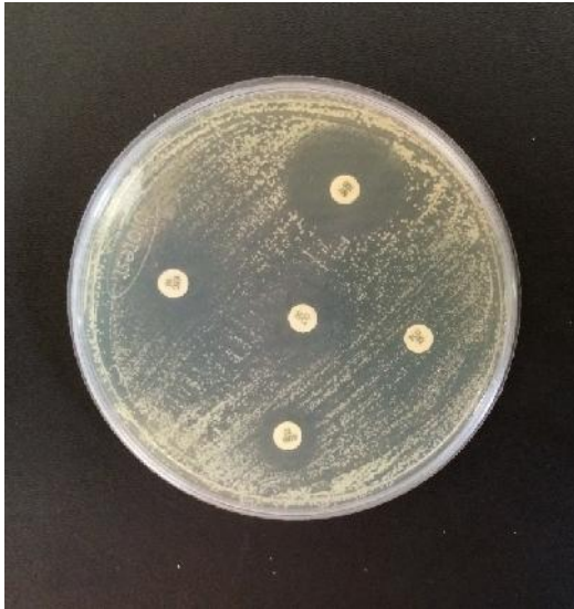
شکل ۲. آنتی بیوگرام کاندیدا با استفاده از پنج دیسک نیستاتین، کلوتریمازول، آمفوتریسین ب، فلوکونازول و کتوکونازول

بدون در نظر گرفتن گونه کاندیدا، الگوی مقاومتی بدست آمده از آنتی بیوگرام (شکل ۲) به شرح زیر بود: بیشترین مقاومت دارویی (۱/۸۱٪) و کمترین حساسیت (۲/۱۸٪) نسبت به فلوکونازول مشاهده شد. در درجات بعدی مقاومت به ترتیب کتوکونازول با ۹/۶۹٪، کلوتریمازول با ۹/۴۶٪، امفوتریسین ب با ۵/۱۷٪ و نیستاتین با ۱/۱۶٪ قرار داشتند. نیستاتین دارای کمترین مقاومت دارویی (۱/۱۶٪) و بیشترین حساسیت (۵/۸۲٪) بین داروهای مورد بررسی بود (جدول ۳).