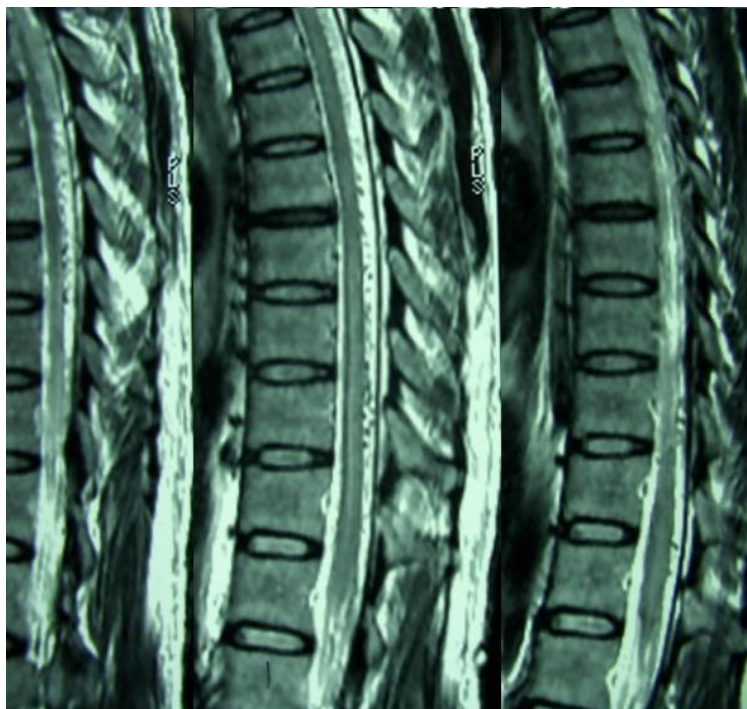
شکل ۱. SDAVF (Spinal Dural Arteriovenous Fistula) در نمای توراسیک

دورسال نخاع از T3 تا کونوس مدولاریس و کودال تا کانال نخاعی کمری وجود داشت. با ماده حاجب موارد ذکر شده افزایش جذب داشت. جهت بیمار آنژیوگرافی قراردادی ۲ انجام شد که DAVF type 1 تایید شد و بیمار جهت عمل جراحی و تصمیم برای انتخاب روش درمان به جراح مغز و اعصاب ارجاع داده شد.