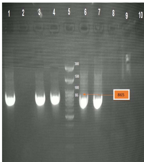
شکل ۲. نتیجه الکتروفورز محصول PCR حاصل از قطعه مورد نظر از ژن SHV-1 به طول ۸۶۵bp: شماره ۱: سویه کنترل مثبت Klebsiella pneumoniae ATCC 700603، شماره‌های ۳، ۴، ۷، ۶: نمونه‌های فنوتیپ مثبت حاوی ژن SHV-1، شماره‌های ۲، ۸، ۹: نمونه‌های فنوتیپ مثبت فاقد ژن SHV-1، شماره ۱۰: کنترل منفی (آب مقطر)، شماره ۵: Ladder

مطالعه‌ای توسط نخعی مقدم و همکاران در سال ۱۳۸۸-۱۳۸۷ در مشهد بر روی ۱۰۹ ایزوله /شربشیاکلی از نمونه‌های ادراری انجام گرفت و ۳۵ ایزوله (۳۲/۱۱٪) مولد بتالاکتاماز وسیع‌الطیف بودند و بیشترین میزان مقاومت به آنتی‌بیوتیک کوتری‌موکسازول و بیشترین حساسیت به ایمی‌پنم بود [۱۰]. گودرزی و همکاران در شهر دلفان در بررسی فراوانی بتالاکتامازهای طیف گسترده روی ۱۰۰ ایزوله /شربشیاکلی، به ۸۰ درصد ایزوله ESBL مثبت دست یافتند. همچنین بیشترین مقاومت مربوط به آمپی‌سیلین با ۸۵ درصد بود و ایزوله‌ها نسبت به ایمی‌پنم هیچ مقاومتی نداشتند [۱۷]. در مطالعه کالاسکار ۱ و همکاران در سال ۲۰۱۲، ۹۴ ایزوله ESBL مثبت بودند و همه باکتری‌ها به آنتی‌بیوتیک ایمی‌پنم کاملاً حساس بودند و نسبت به آنتی‌بیوتیک‌های آمپی‌سیلین، آرتروئنام و کوآموکسی کلاو ۱۰۰ درصد مقاوم بودند [۱۸]. یک مطالعه توسط سربسنگاو ۲ و همکاران در سال ۲۰۰۴ در تایلند، ۱۸۲ ایزوله مولد ESBL بودند. در این مطالعه میزان مقاومت نسبت به آنتی‌بیوتیک‌های سفتریاکسون، سفوتاکسیم و سفنازیدیم به ترتیب برابر ۹۷/۲۵، ۹۷/۲۵ و ۷۴/۱۸ درصد بود که نشان‌دهنده وجود مقاومت بالا به سفالوسپورین‌های نسل سوم در بیمارستان‌های تایلند می‌باشد [۱۹].