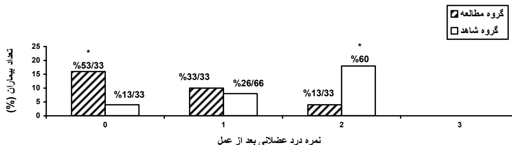
شکل ۲. شیوع و شدت میالژی بعد از عمل در بیماران دو گروه مطالعه p < ۰/۰۰۰۱ *