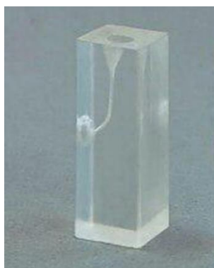
شکل ۲. نمونه بلوک رزینی

در گروه Smart Tract X3 بعد از بررسی مسیر با k فایل دستی شماره ۱۵ (Mani, Tochigi, Japan) و تعیین طول کانال ابتدا فایل N1 (سایز ۱۷/۶٪) و N2 (سایز ۱۷/۴٪) با حرکت Brushing در ۲/۳ کرونال کانال استفاده شد، سپس Nx (سایز ۱۲/۲۵٪) برای شکل‌دهی دهانه کانال به کار برده شد و آماده‌سازی کانال با فایل C1 (سایز ۲۰/۶٪) و C2 (سایز ۲۵/۶٪) کامل شد. سرعت دستگاه روتاری (NSK, Nakanishi, Japan) برای تمامی این فایل‌ها ۳۰۰ دور بر دقیقه و میزان تورک ۳Ncm بود.