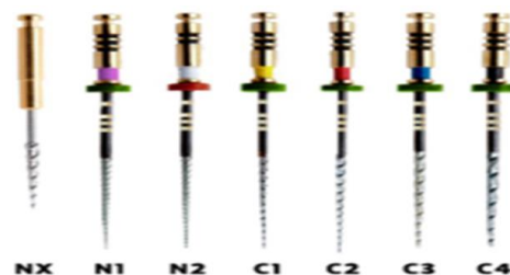
شکل ۱. فایل Smart tract X3

[۳-۵]. در سال‌های اخیر بهبود خواص ترمومکانیکی آلیاژهای Ni-Ti برای رفع این محدودیت‌ها از طریق عملیات حرارتی، پولیش الکتریکی و ماشین کاری تخلیه الکتریکی توجه زیادی را به خود جلب کرده است [۶]. هدف از عملیات حرارتی انتقال فاز مارتنزیتی بیشتر به فایل‌ها در دمای معمولی بدن برای به دست آوردن حداکثر مزیت انعطاف‌پذیری در مقایسه با فاز آستنیتی و همچنین بهبود مقاومت در برابر خستگی چرخه‌ای در مقایسه با آلیاژهای Ni-Ti معمولی است [۷]. Smart Tract X3 (تصویر ۱)، یک سیستم فایل چرخشی جدید اصلاح شده با حرارت است که شامل یک فایل Nx (۱۲/۲۵٪) برای شکل‌دهی دهانه کانال، و شش عدد فایل برای پاکسازی کانال می‌باشد (N1: ۱۷/۶٪، N2: ۱۷/۴٪، C1: ۲۰/۶٪، C2: ۲۵/۶٪، C3: ۳۰/۶٪، C4: ۴۰/۶٪) و ادعا می‌شود مقاومت بالایی در برابر شکستگی در کانال‌های ریشه انحنادار دارد. با توجه به عدم انجام مطالعات در مورد فایل Smart Tract X3 در مقایسه با سیستم فایل‌های چرخشی آلیاژهای Ni-Ti که به طور معمول استفاده می‌شود، مطالعه حاضر با هدف بررسی میزان شکست، محل شکست، طول و فاصله قطعات شکسته شده Smart Tract X3 از راس بلوک در مقایسه با سیستم فایل‌های چرخشی Neoniti و ProTaper در کانال‌های ریشه با انحنای شدید انجام شد.