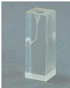
شکل ۲. نمونه بلوک رزینی

در گروه Smart Tract X3 بعد از بررسی مسیر با k فایل دستی شماره ۱۵ (Mani, Tochigi, Japan) و تعیین طول کانال ابتدا فایل N1 (سایز ۱۷/۶٪) و N2 (سایز ۱۷/۴٪) با حرکت Brushing در ۲/۳ کرونال کانال استفاده شد، سپس Nx (سایز ۱۲/۲۵٪) برای شکل‌دهی دهانه کانال به کار برده شد و آماده‌سازی کانال با فایل C1 (سایز ۲۰/۶٪) و C2 (سایز ۲۵/۶٪) کامل شد. سرعت دستگاه روتاری (NSK, Nakanishi, Japan) برای تمامی این فایل‌ها ۳۰۰ دور بر دقیقه و میزان تورک ۳Ncm بود.