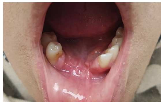
شکل ۴. نمای بالینی بعد از شش ماه

دو سلول اصلی موجود در موکوپیدرموئید کارسینوما، سلول‌های تولیدکننده موسین و سلول‌های اپیدرموئید هستند. سلول‌های تولیدکننده موسین، سیتوپلاسم کف‌آلود دارند و با رنگ آمیزی موسین،