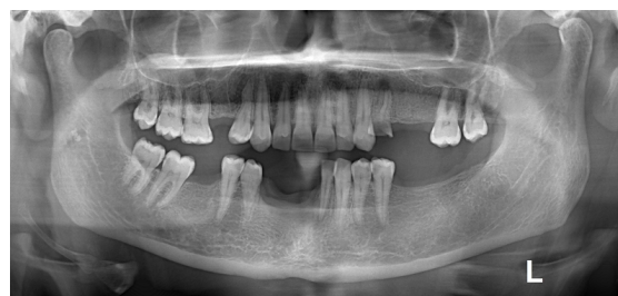
شکل ۵. نمای رادیوگرافی پس از شش ماه