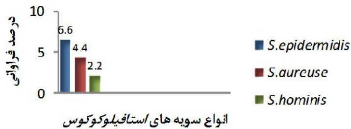
نمودار ۱. توزیع درصد فراوانی سویه‌های مختلف استافیلوکوکوس به تفکیک جنس و گونه در نمونه‌های مورد مطالعه (بیمارستان شهید افشاری پور کرمان - مهر ۹۵ تا بهمن ۹۵)